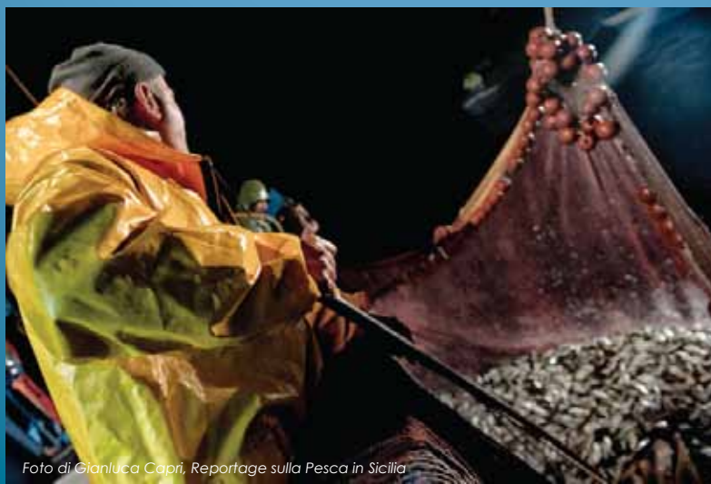
Reportage sulla Pesca in Sicilia

Le Regioni sono partner istituzionali per l'attuazione del Programma. Un ruolo di primo piano è svolto dai Gruppi di Azione Costiera (GAC) che hanno il compito di rafforzare il ruolo delle comunità di pescatori nello sviluppo locale. Il Ministero dell'Ambiente e della Tutela del Territorio e del Mare (MATM) è Autorità Competente per la VAS, di concerto con il Ministero dei Beni e delle Attività Culturali e del Turismo (MIBACT). A queste istituzioni compete l'elaborazione del parere motivato, espresso sulla base dell'istruttoria svolta e degli esiti delle consultazioni, che conclude la fase di valutazione di VAS.