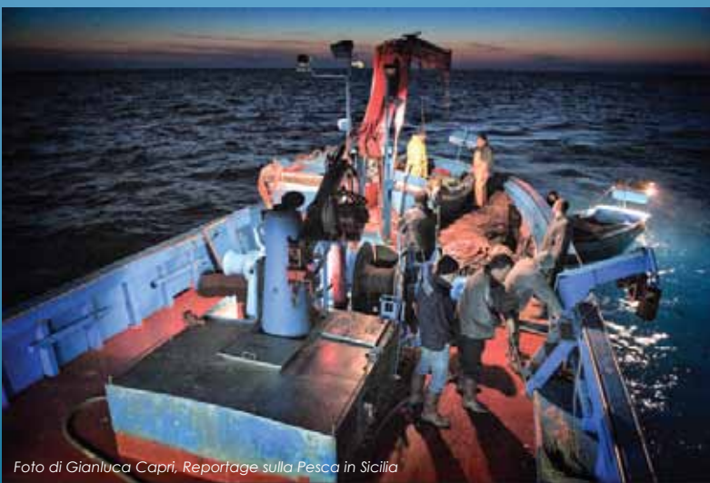
Reportage sulla Pesca in Sicilia

La pesca e l'acquacoltura hanno un forte radicamento nella tradizione italiana e hanno caratterizzato nel tempo paesaggi costieri, fluviali e lacustri. Il PO interviene a favore della valorizzazione del patrimonio culturale e paesaggistico, sia con azioni a favore delle comunità locali, sia con interventi di promozione di attività turistiche sostenibili, come pescaturismo e ittiturismo.